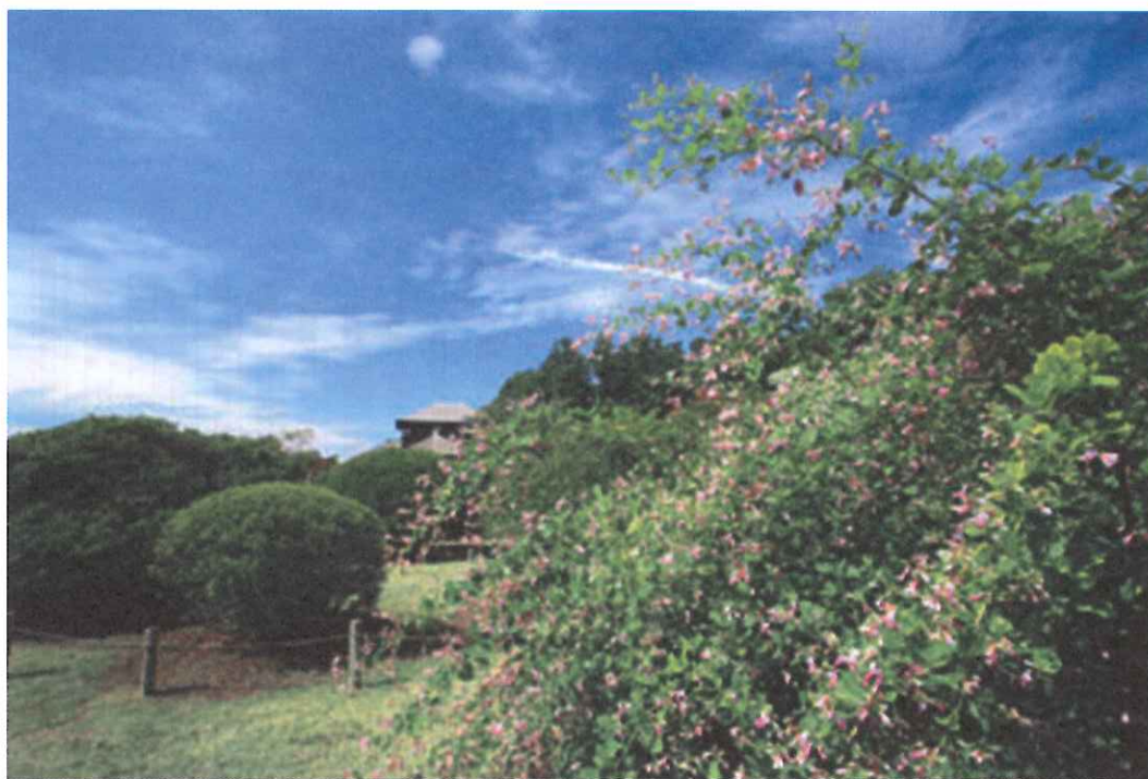
「借楽園の萩（水戸市）」 いばらきフォトダウンロード