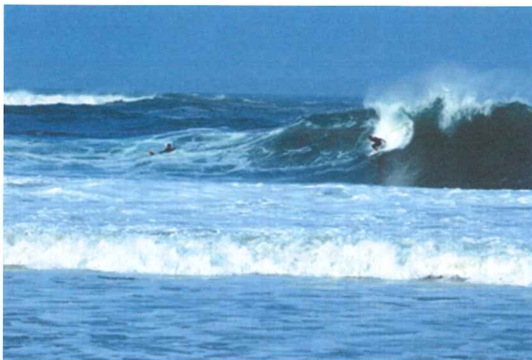
「河原子海岸（日立市）」