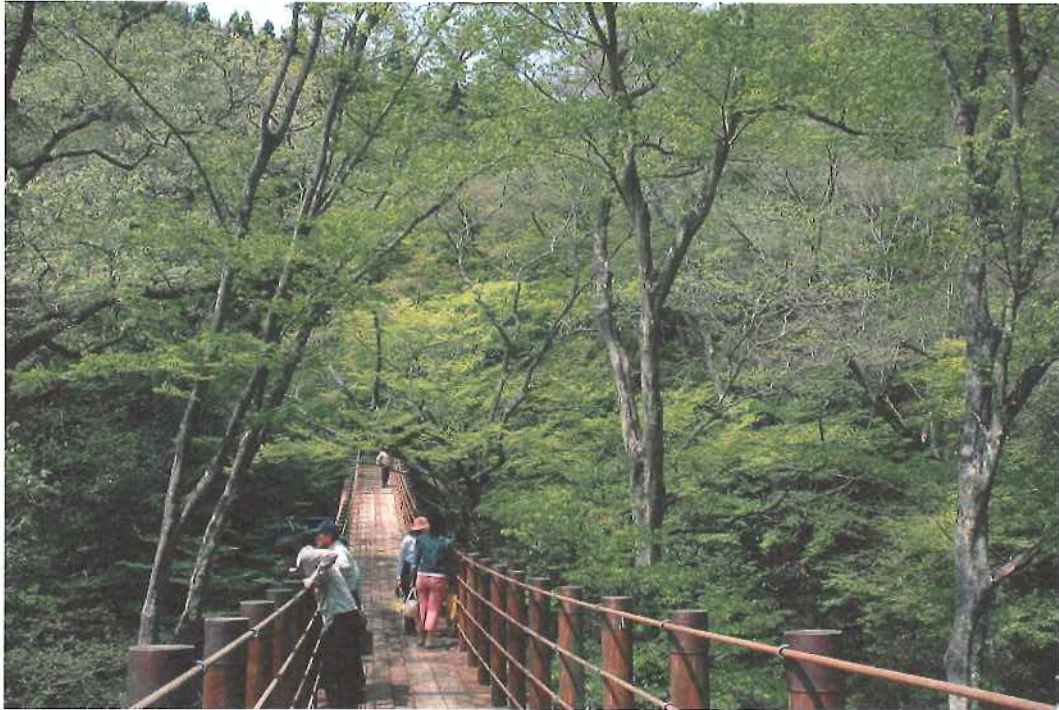
「花貫溪谷（高萩市）」