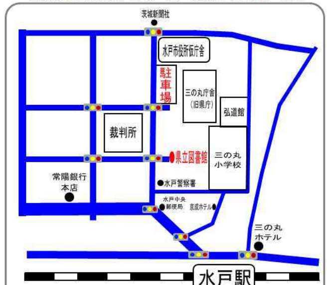
茨城県立図書館：水戸市三の丸1丁目5-38

※水戸駅北口より、徒歩7～8分 ※車でお越しの際は必ず三の丸庁舎駐車場をご利用ください。