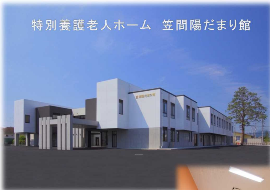
特別養護老人ホーム 笠間陽だまり館