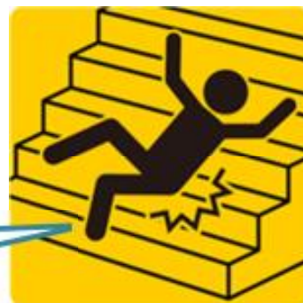
階段での踏み外しによる転倒 (足下の安全確認)