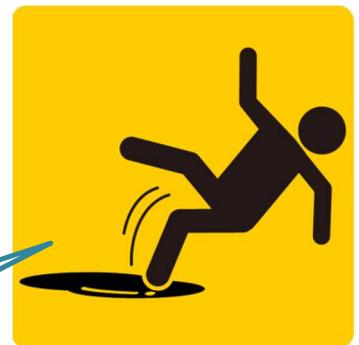
滑りによる転倒 (安全な通路の確保)