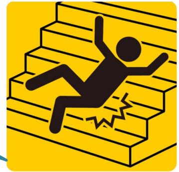
階段での踏み外しによる転倒 (足下の安全確認)