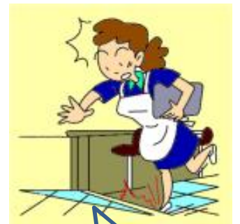
つまづきによる転倒