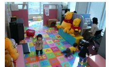
全オフィスに保育士を常駐安心してお仕事探しに専念