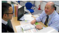
業界に精通した専任がマン・ツー・マンでサポート!