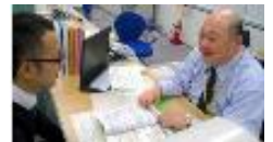
業界に精通した専任がマン・ツ・マンでサポート!