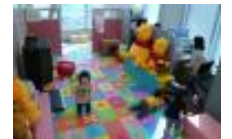
全オフィスに保育士を常駐 安心してお仕事探しに専念!