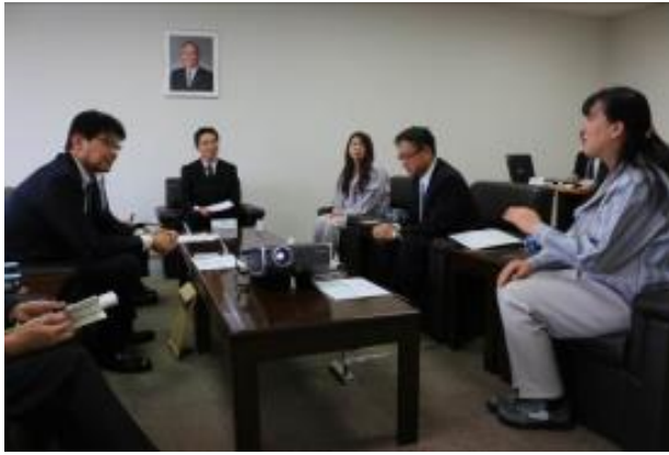
社員の方々を交え、意見を交換