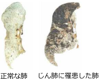
正常な肺 じん肺に罹患した肺

主に小さな土ぼこりや金属の粒などの粉じんを長年吸い込むことで、肺の組織が線維化し、硬くなってしまふ病気で、根本的な治療がありません。