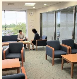
休憩可能なフリースペース