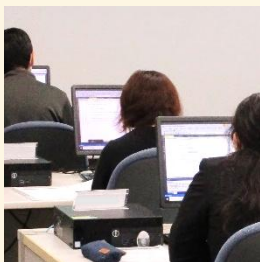
PCデスクは1人1台用意