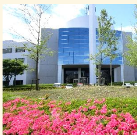
ひたちなかテクノセンター

事務作業で必要となるパソコンや周辺機器の取り扱いを学習するとともに、文書作成（ワード）、表計算（エクセル）、プレゼンテーション（パワーポイント）、セキュリティ、電子メールによる情報通信等を習得します。また、キャリアコンサルタントによる就職支援が受けられます。