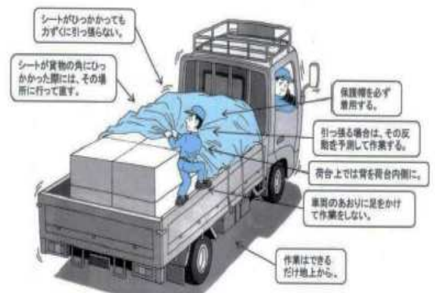
【荷役作業の墜落・転落災害防止の対策のポイント】