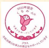
認定マーク 「くるみんプラス」