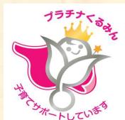
認定マーク 「プラチナくるみん」