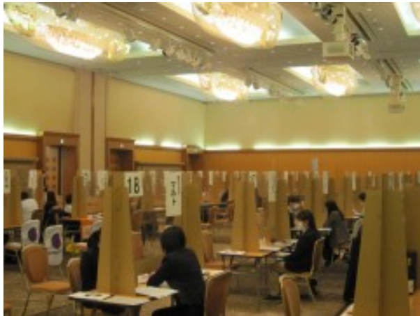
▲就職面接会：リアル会場の様子 一対一での面接、質問、自己PRに頑張っている。