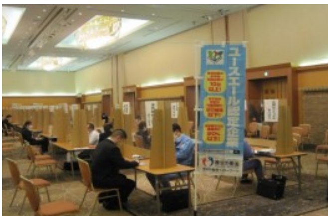
▲「ユースエール認定企業」ブースで説明を聞き、面接を受けている様子。

茨城労働局、県内各ハローワーク及び茨城県では、年度後半になっても内定を得ることができない大学等卒業予定者の就職活動を支援し、未内定のまま卒業することを防ぐため、民間企業への委託により、「2023年3月卒業予定の大学生等向けの就職面接会」として「リアル(ホテル会場での対面)」と「WEB(インターネット上の会場でビデオ通話)」のハイブリッド方式で同時に開催しました。