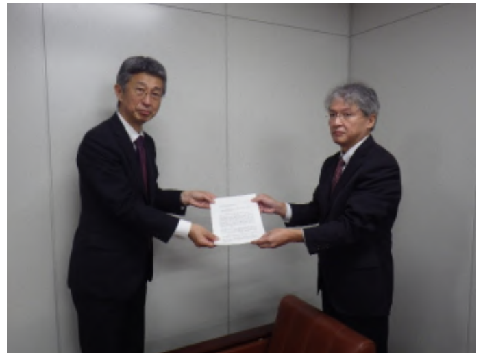
茨城労働基準協会連合会 左)茨城労働局 下角局長