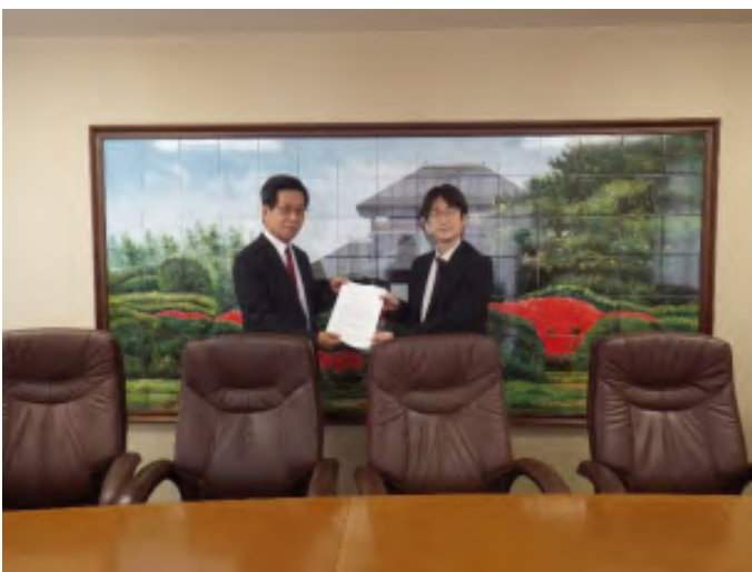
茨城県建設業協会 右) 茨城労働局 労働基準部長