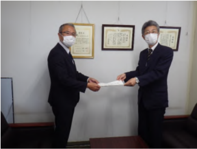
茨城県中小企業団体中央会 右)茨城労働局 下角局長