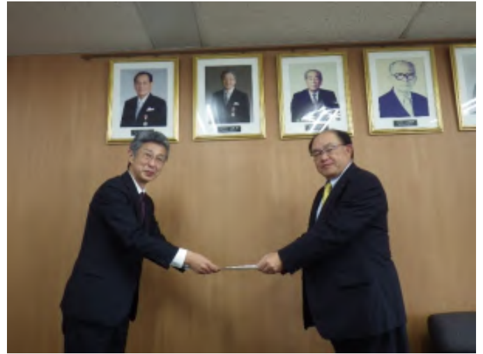
茨城県商工会連合会 左)茨城労働局 下角局長