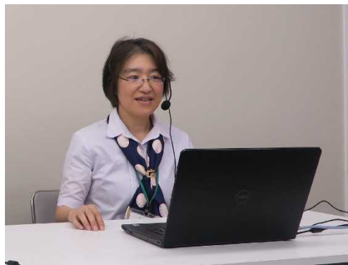
「パワハラ対策」、「改正育児・介護休業法」について説明する 雇用環境・均等室 職員

茨城労働局監督課では、事業主の皆さまを対象として「『働き方改革』関連法に関する説明会」（以下「説明会」といいます。）を各監督署にて全19回（リアル・オンライン）開催することとしています。