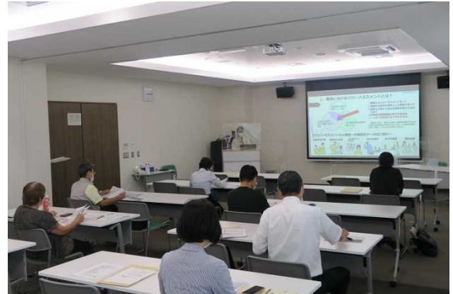
「労働施策総合推進法」及び「改正育児・介護休業法」について説明する雇用環境・均等室 職員

働き方改革関連法による労働基準法の改正により、令和6年4月から自動車運転者についても、時間外労働の上限規制が適用されることとなります。これとあわせて「自動車運転者の労働時間等の改善のための基準」（いわゆる「改善基準告示」）についても見直しが行われ、このたびバス事業者を対象として改善基準告示の見直し案の内容について土浦労働総合庁舎にて説明会を行いました。