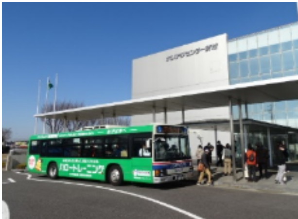
参加者が乗ったラッピングバス