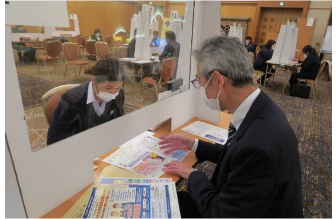
▲労働局の認定制度について説明し、取り組みを勧奨する雇用環境・均等室職員（右）