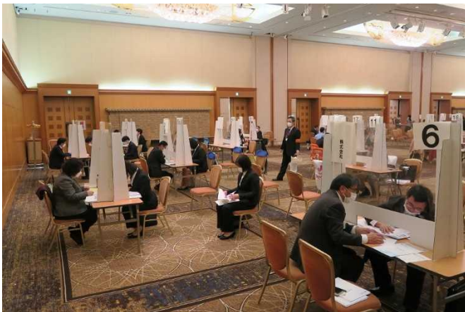
▲「大学生等就職面接会」の会場の様子