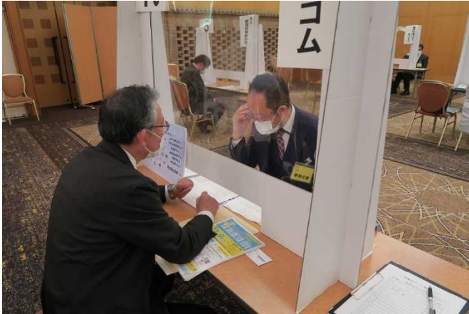
▲女性活躍推進法に基づく一般事業主行動計画の策定概要について説明する雇用環境・均等室職員（左）