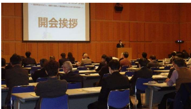
主催者挨拶 茨城労働局 労働基準部長