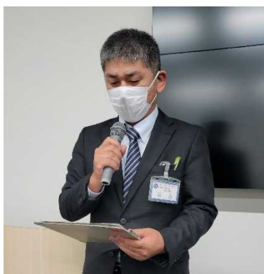
説明会開催に先立ち挨拶される石岡市 市長公室 政策企画課 細谷課長