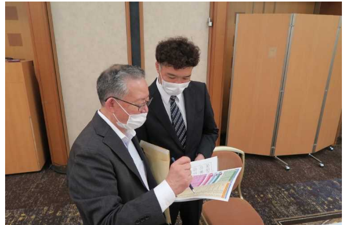
▲労働局の認定制度について説明し、取り組みを勧奨する雇用環境・均等室職員（左）