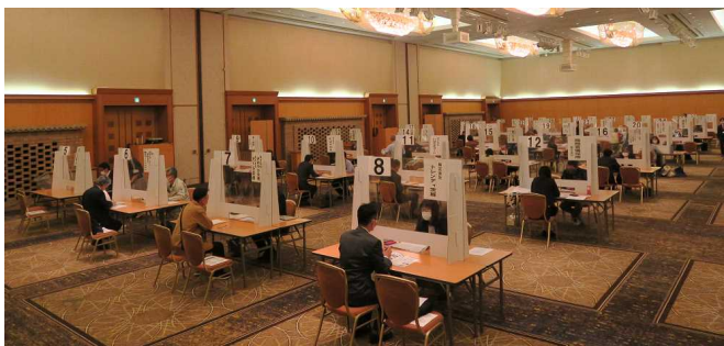
▲ハローワーク水戸・笠間・常陸大宮合同開催「2021 就職応援フェア」の会場の様子