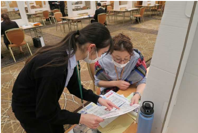
▲女性活躍推進法に基づく一般事業主行動計画の策定概要について説明する雇用環境・均等室職員（左）