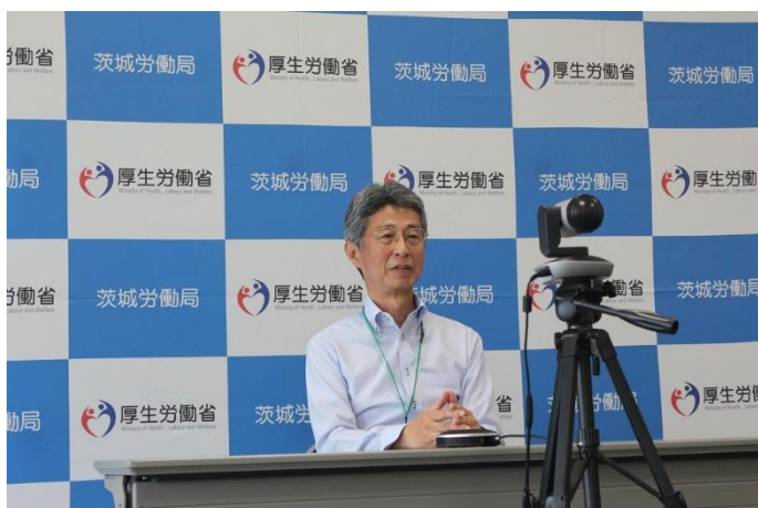
カメラに向かってメッセージを伝える下角局長