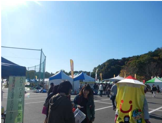
リーフレット配付風景