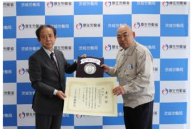
＜奨励賞＞清水・岡部・山本特定建設工事共同企業体 土浦駅北地区第一種市街地再開発事業施設 建築物 新築工事

清水・岡部・山本特定建設工事共同企業体は、土浦駅北地区第一種市街地再開発事業施設建築物新築工事において、清水建設(株)関東支店茨城営業所を通じ、定期的作業所の巡視、協力会社への教育・啓蒙活動・安全先取り工法の検討といった全面的なバックアップ、現場の自主的管理の活発化等により、449,623時間（平成29年11月1日）の無災害記録時間を達成しました。