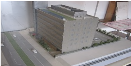
茨城労働局総合庁舎の模型

5日(火)、雇用環境・均等室にて広報活動を体験させていただきました。「X(旧Twitter)」に投稿する文章などを作成しました。実際に広報活動に参加したことで、情報発信の重要性を実感することができました。