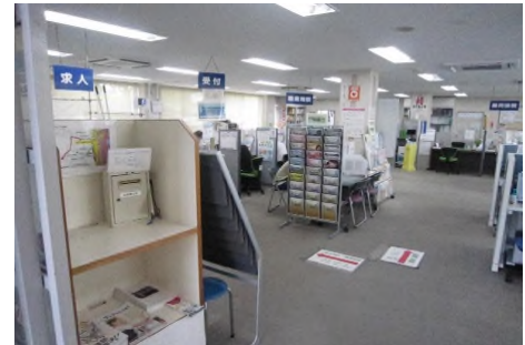
ハローワーク水戸の職業相談窓口

今まで抱いていた不安が和らいだと共に、就職活動に向けての意欲が高まりました。今日いただいたアドバイスを胸に、今後の就職活動により一層励んでいきたいです。