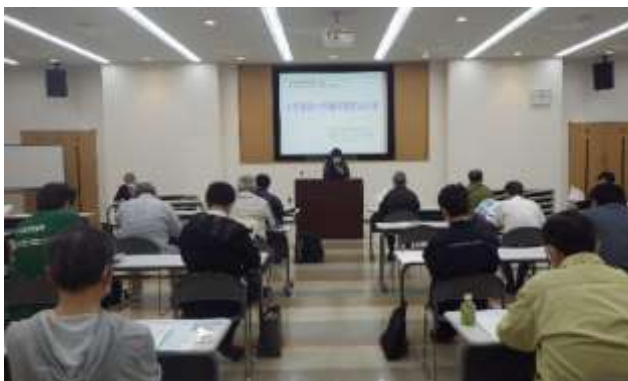
↘日立労働基準監督署長による挨拶（左上）