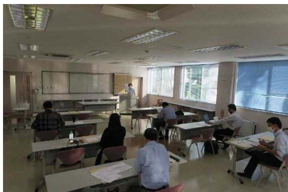
「改正育児・介護休業法」について説明する▼ 雇用環境・均等室職員（右下）