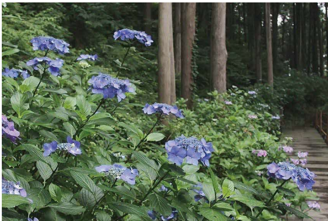
涸沼自然公園 茨城町