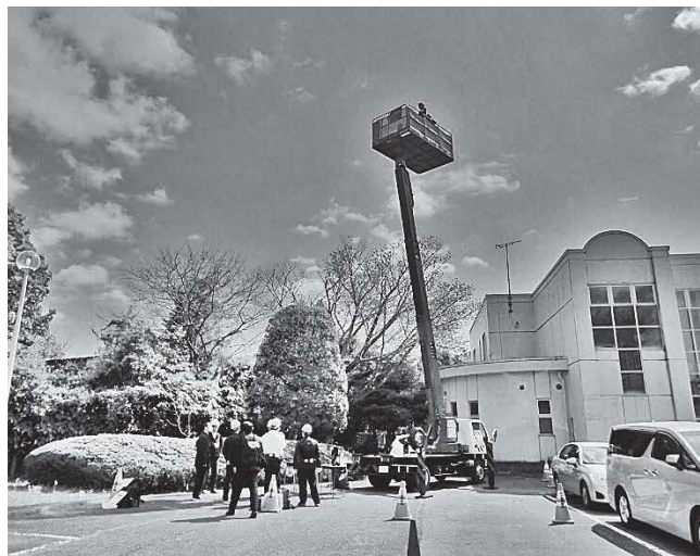
(高所作業車の試乗体験)