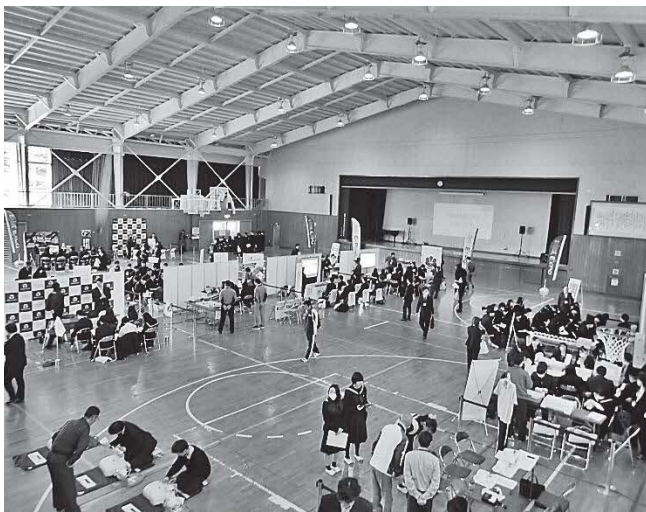
(屋内会場全体の様子)

ハローワーク高萩では、今後も自治体や商工会等と連携し、若年者の雇用促進に努めてまいります。