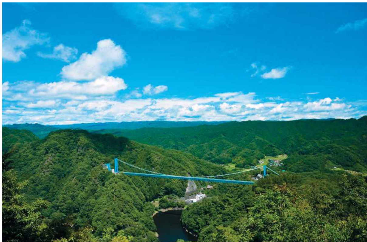
竜神大吊橋 常陸太田市