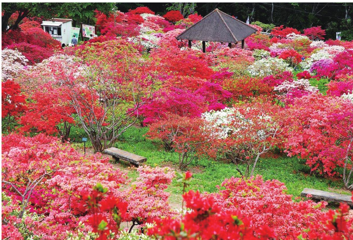
笠間つつじ公園 笠間市