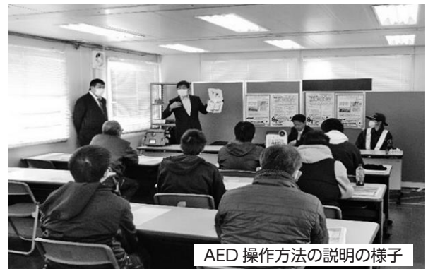
AED操作方法の説明の様子

ハローワーク常陸鹿嶋は、令和8年2月20日（金）に株式会社FUYOUと「警備のお仕事体験・説明会」をハローワーク常陸鹿嶋で開催しました。