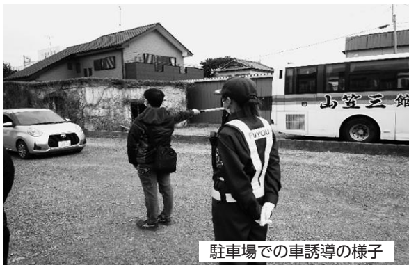
駐車場での車誘導の様子