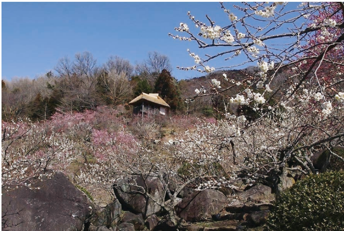
筑波山梅林 つくば市