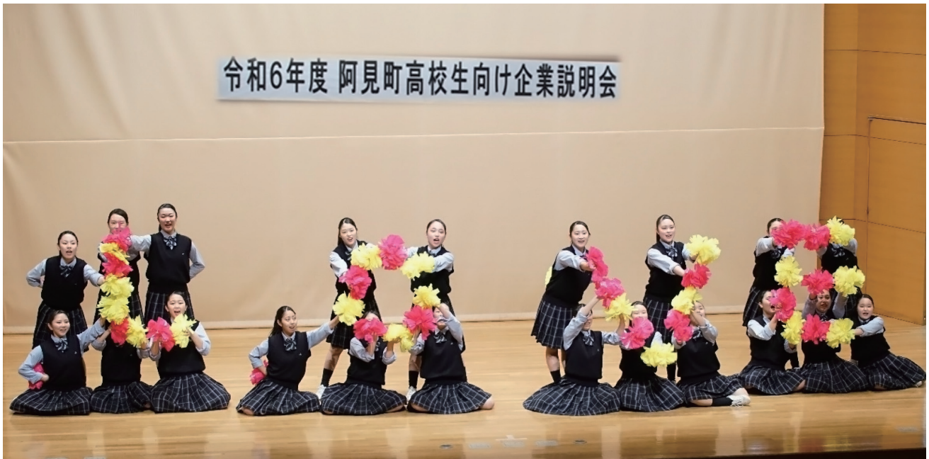
霞ヶ浦高等学校チア・ダンス部 SPARKLE☆BUNNIES による OP パフォーマンス ～阿見町高校生向け企業説明会にて～