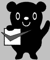
最低賃金制度のマスコット チェックマン