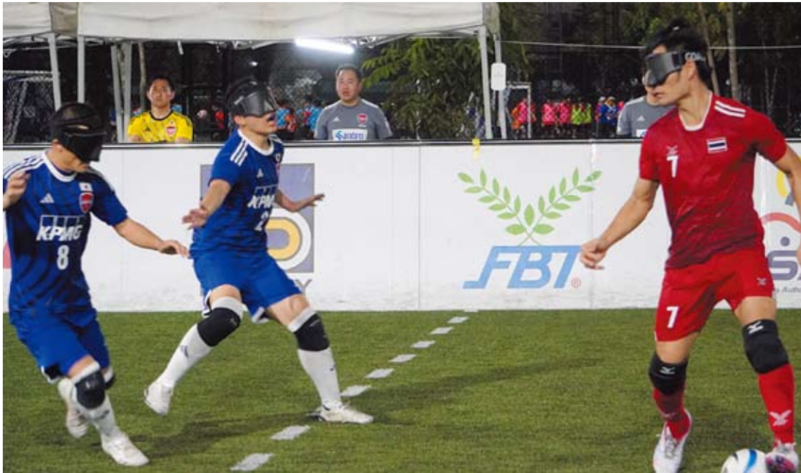
感覚を研ぎ澄ませ！～仲間を信じて～