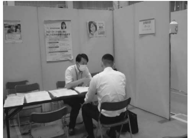
ハローワーク下妻の相談ブースの様子

ハローワーク下妻も相談ブースを設置して、公的職業訓練や就職に関する情報を提供するなどを行いました。