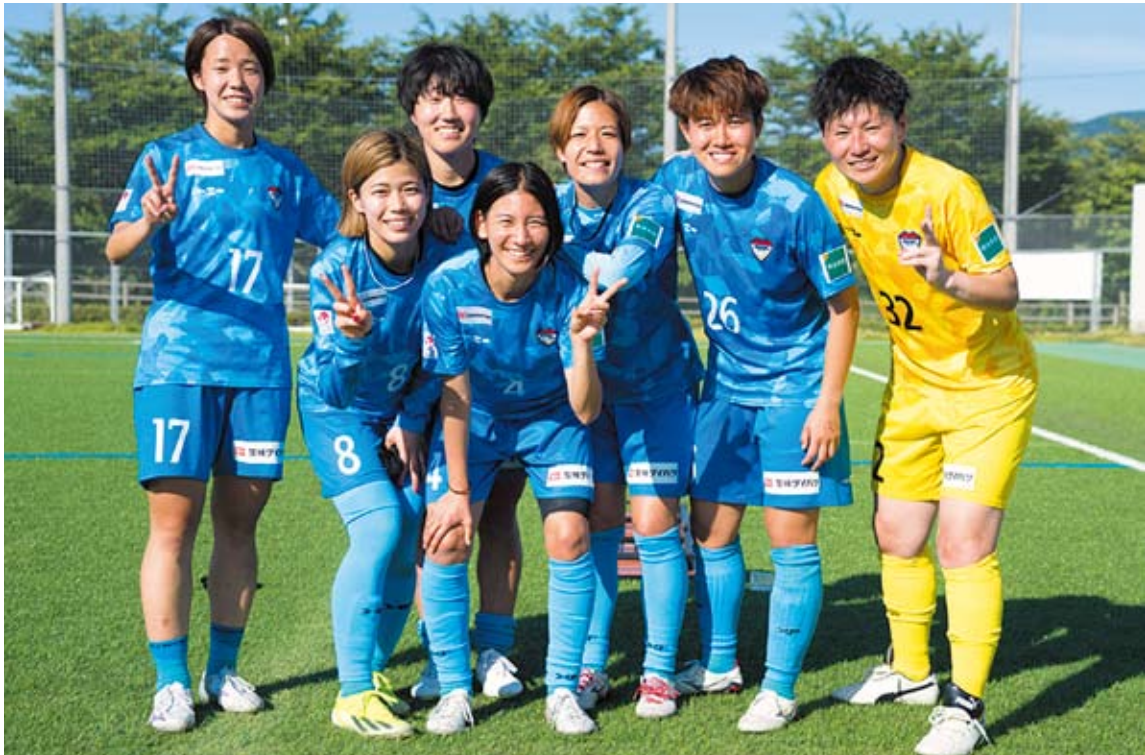
つくばFCレディース選手の皆さん～試合の後に～