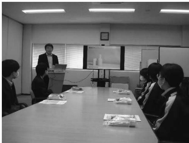
企業からの説明の様子

バスツアーに参加した高校生からは「貴重な体験で良かった」、「今回の見学を参考にして、就職活動に活かしていきたい」、「自分の将来について深く考える良い機会になった」などの感想がありました。一方で参加した事業所からは「高校生に直接、会社の説明を行う機会が少ないため貴重な時間となった」、「実際に工場内をみていただいて、仕事の魅力を伝えることができ良かった」などの声がありました。