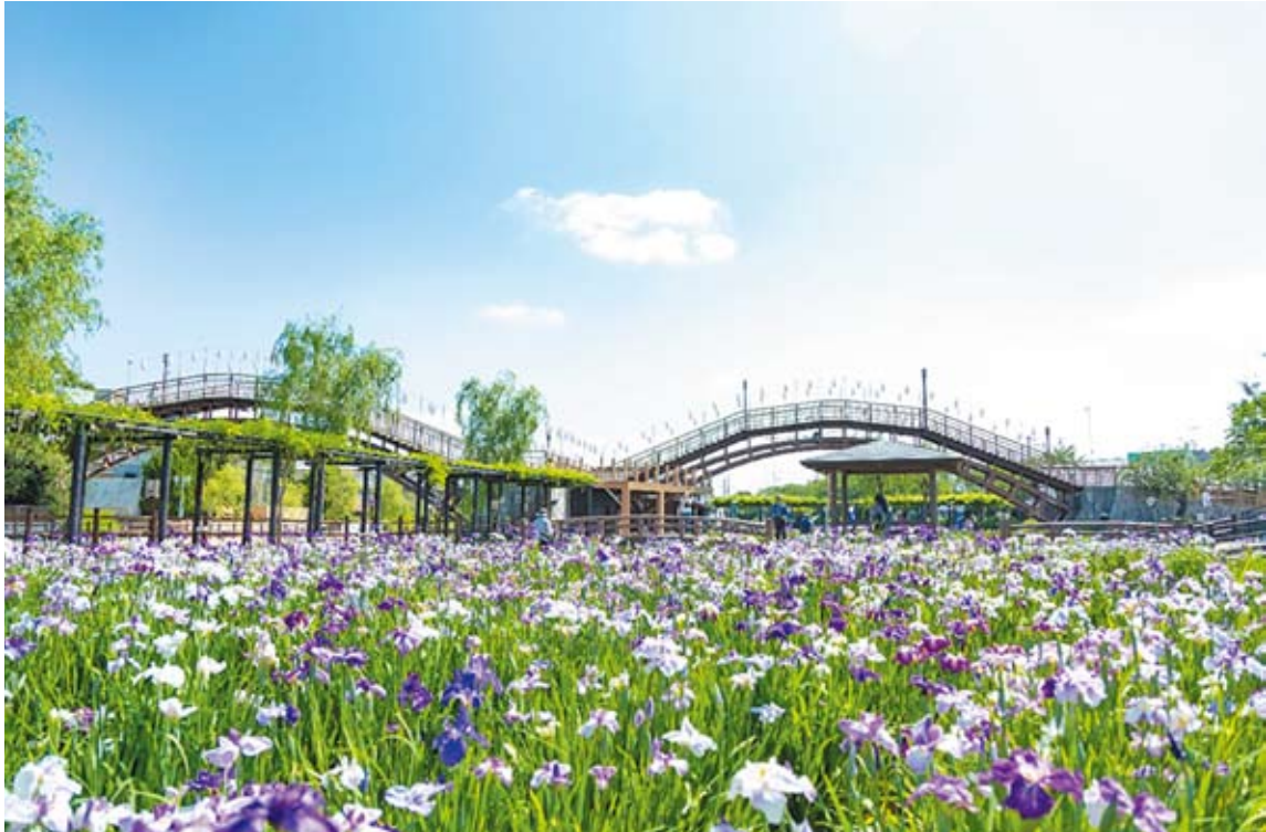
第73回水郷潮来あやめまつり 6 / 16まで開催中