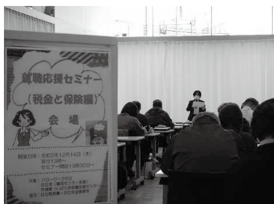
写真：セミナーの様子（12月14日開催）

働き方を考える上で重要な「税金と保険」についてのセミナーを日立市（雇用センター多賀）と茨城県（いばらき就職支援センター）と共催で実施しました。