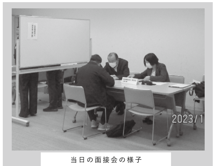
当日の面接会の様子

多くの外国人求職者が求人者と出会う機会を今後も模索して、各関係機関と連携しながら就職促進に繋げていきたいと思っております。