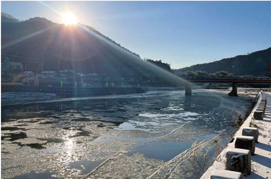
久慈川の氷花（シガ）