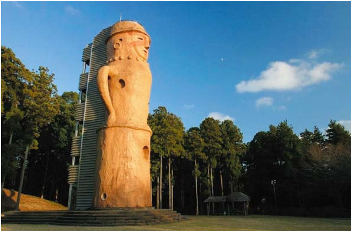
「くれふしの里古墳公園（水戸市）」