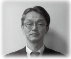
労働局長 澤口 浩司