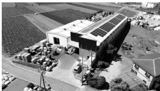
事業内容：プラスチック原料の製造

昭和39年4月創業、食品包装フィルムなどの廃プラスチックフィルムをリサイクルし、原材料として再利用できるよう処理を行う、プラスチック再生加工に特化した事業を展開している。