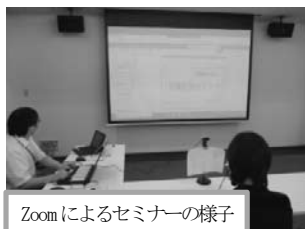
Zoomによるセミナーの様子

ハローワーク土浦マザーズコーナーは、令和3年10月8日（金）、子育てをしながら働きたいと願う方々にzoomを利用した「マザーズ就職応援セミナー～事前準備をはじめよう～」を開催しました。