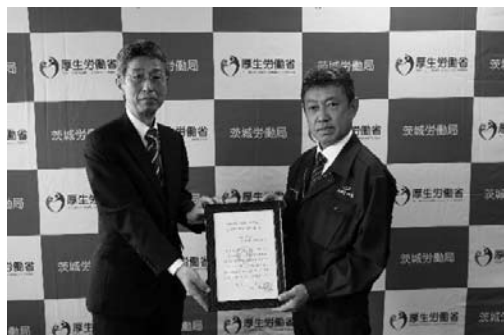
茨城労働局 局長 下角 圭司