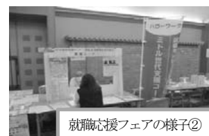
就職応援フェアの様子②

今後は、今回のフェアで接点をもった会社と求職者が1件でも多くマッチングできるよう引き続き各ハローワークで支援を行ってまいります。