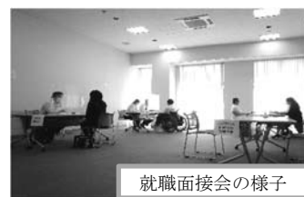
就職面接会の様子

ハローワーク下妻では、今後とも各自治体と連携し、ひとりでも多くの障害者の方が就職していただけるよう支援をまいります。