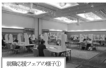
就職応援フェアの様子①

ハローワーク水戸・笠間・常陸大宮は、令和3年10月27日（水）水戸市宮町のホテルレイクビュー水戸において、建設、運輸、警備、介護、看護、保育など人材不足分野への就職を希望される方や、就職氷河期世代（35～54歳）の方を対象とした就職応援フェアを開催しました。今回のフェアは、いばらきアマビエちゃんへの登録、面接・相談を事前予約制で1回当たり15分とし各回実施の都度ブースを除菌するなど、感染対策を徹底して実施しました。