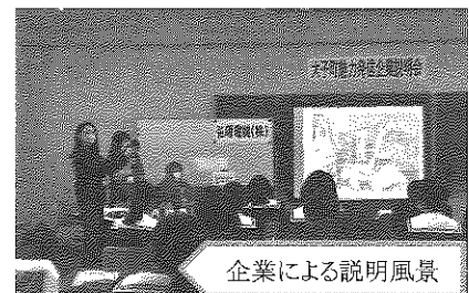
企業による説明風景

また、説明を受けた生徒の感想は、「町内にこんな企業があることを知らなかったのがよかった」等、進路の決定の参考に大いに役立ったようでした。