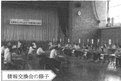
情報交換会の様子

ハローワーク下妻は、令和3年6月18日（金）、八千代町と茨城労働局において締結している雇用対策協定に基づき、近隣高校と地元企業を対象とした就職情報交換会を八千代町総合体育館において開催しました。