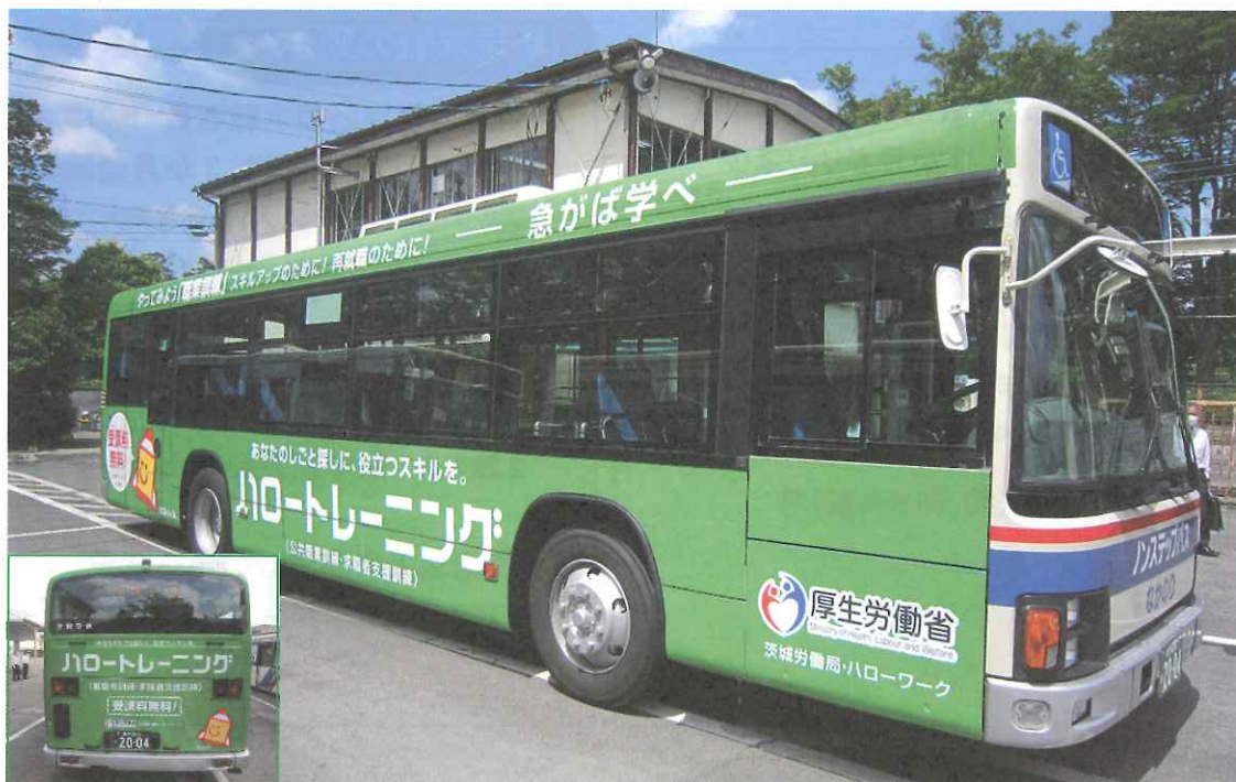
ハロートレーニング（公的職業訓練）の活用促進を図るため、路線バスを活用した周知広報を実施しています。（令和4年3月末まで）