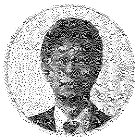
茨城労働局長 下角 圭司