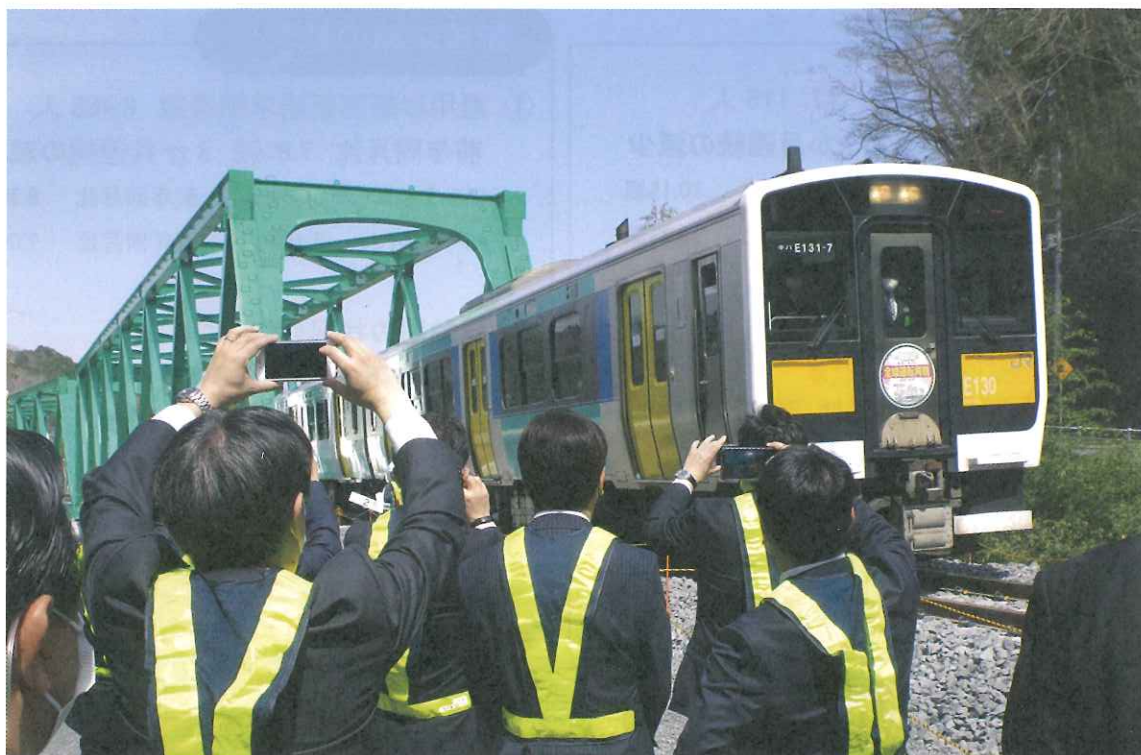
水郡線全線運転再開しました！