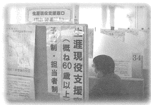
ハローワーク水戸