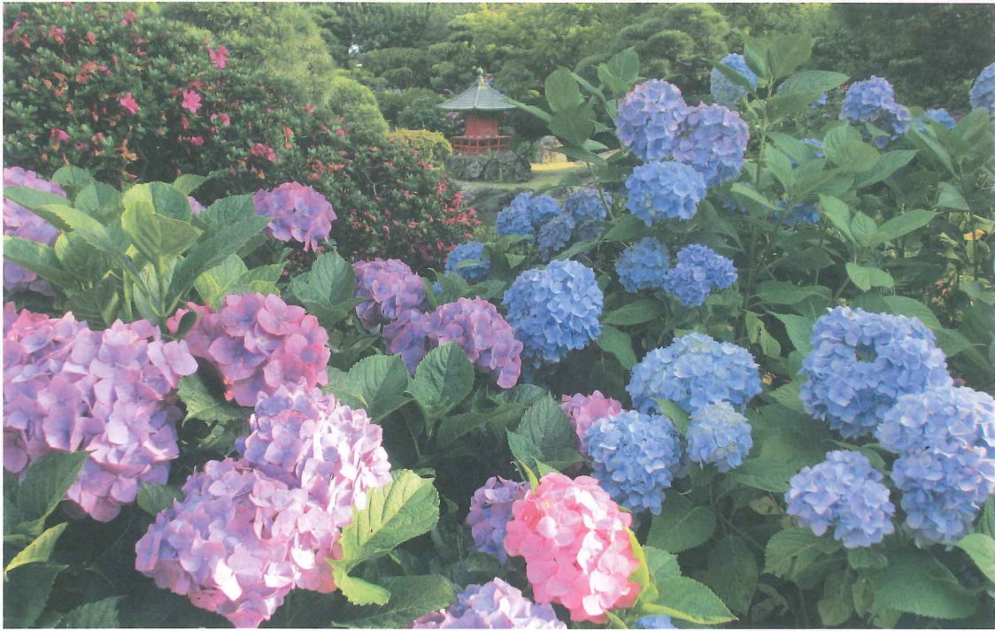
保和苑では、西洋あじさい・がくあじさいなど約100種6,000株が色鮮やかに咲き誇ります。 第45回水戸のあじさいまつり：6/9(日)～6/30(日)(保和苑及び周辺史跡)