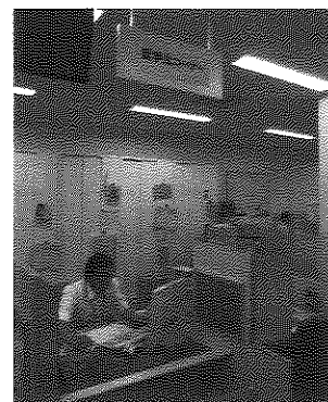
ハローワーク土浦の留学生コーナー