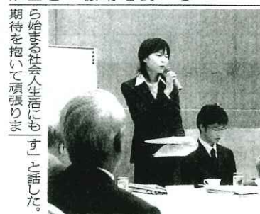
関彰育英会の交流会で学生生活の報告をする奨学生（中央）＝つくば市内のホテル