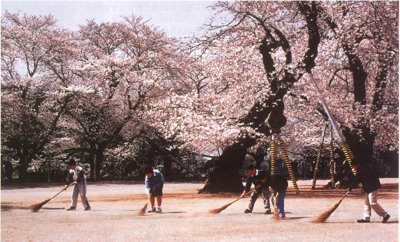
-花の校庭- いばらき自然環境フォトコンテスト 環境保全茨城県民会議議長賞