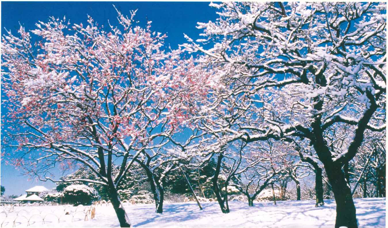
—雪化粧— (水戸市) いばらき自然環境フォトコンテスト佳作