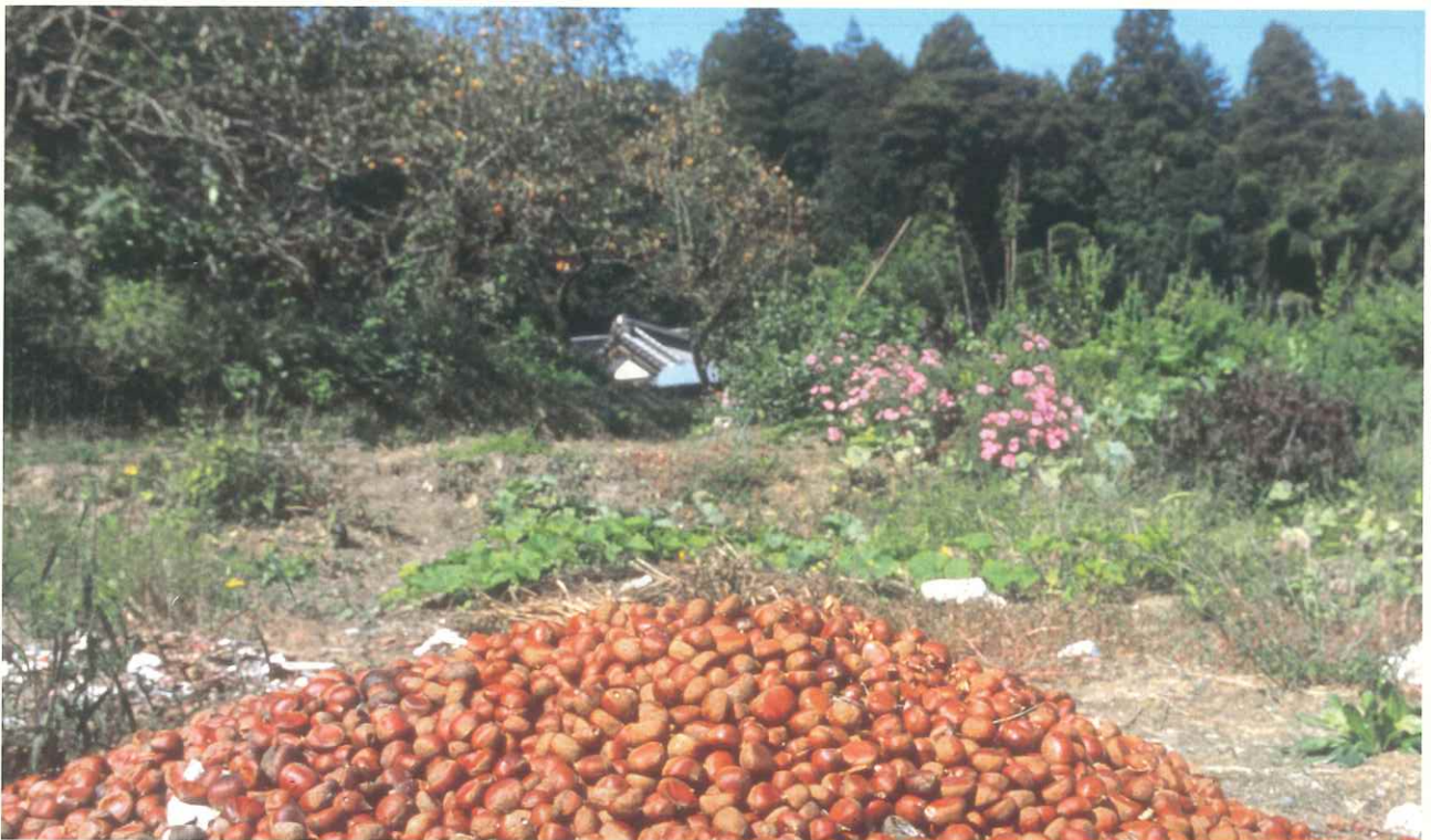
—栗の山— (笠間市) いばらき自然環境フォトコンテスト優秀賞